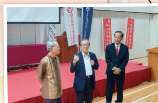
法務部前部長施茂林蒞臨致詞