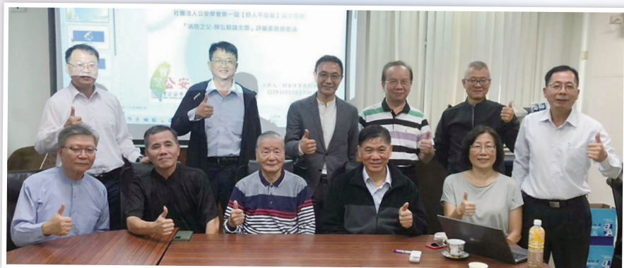
邀請榮譽理事長陳弘毅前署長（前排右3）蒞臨指導

第二階段的評審作業預計在 2024 年 11 月 30 日前完成，最終獲獎名單將於 12 月 16 日公布，並於 2025 年 1 月 11 日星期六晚上舉行感恩餐宴暨論文的頒獎典禮，屆時將邀請所有參與者共襄盛舉，分享這份榮耀與喜悅。