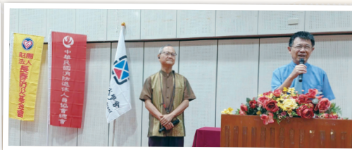
受邀貴賓一一邀請致詞