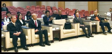
第 04 版 10月23日總會長唐雲明拜會立法院長韓國瑜。