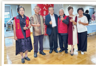
前法務部長施茂林(左3)與幹部們合照