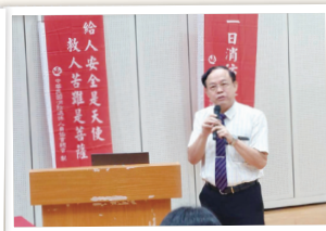
邀請中央研究院院士葉均蔚蒞會講座