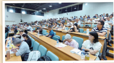
研討會會場滿場學員，研習成效非凡